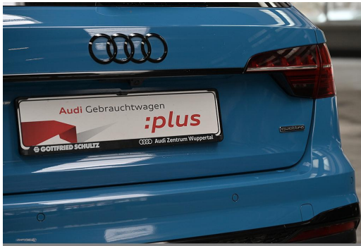
Audi Zentrum Wuppertal GOTTFRIED SCHULTZ