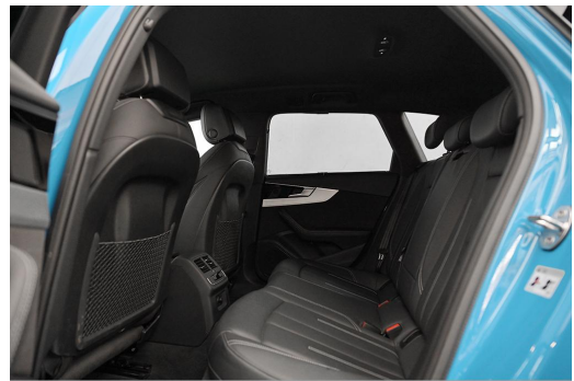
Audi Zentrum Wuppertal GOTTFRIED SCHULTZ