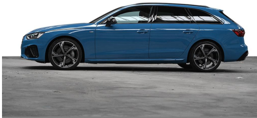
Audi Zentrum Wuppertal GOTTFRIED SCHULTZ