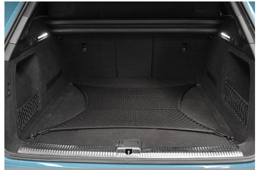
Audi Zentrum Wuppertal GOTTFRIED SCHULTZ