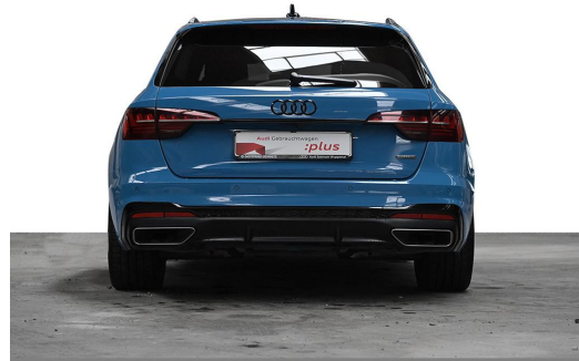
Audi Zentrum Wuppertal GOTTFRIED SCHULTZ