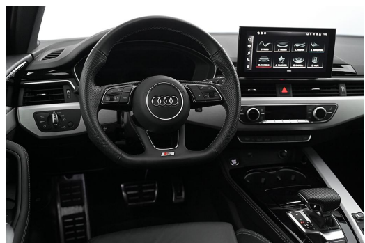
Audi Zentrum Wuppertal GOTTFRIED SCHULTZ