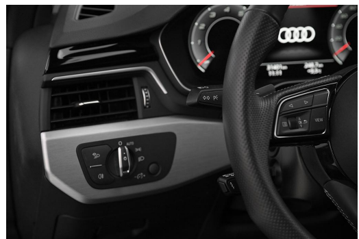
Audi Zentrum Wuppertal GOTTFRIED SCHULTZ