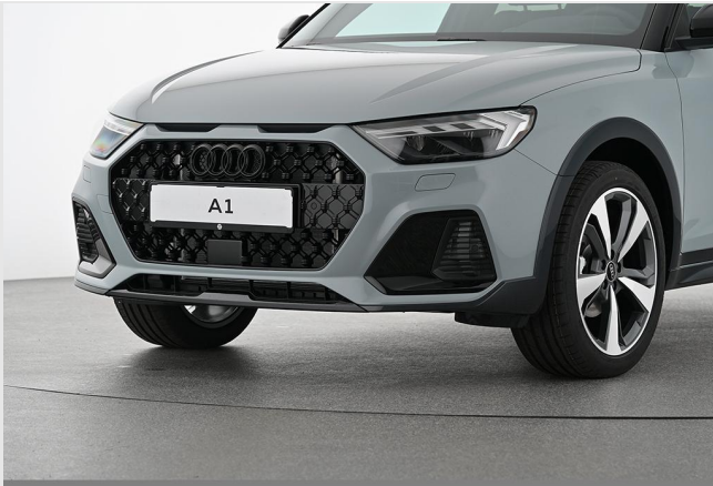
Audi Zentrum Essen GOTTFRIED SCHULTZ

Angebotsnummer: 83228 Ausdruck vom: 27.04.2024