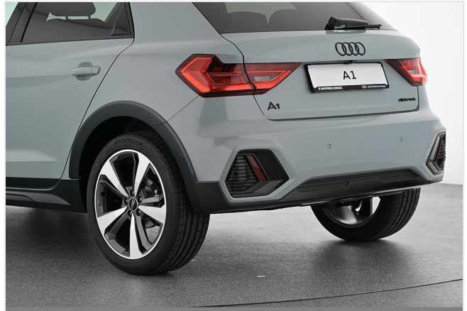
Audi Zentrum Essen GOTTFRIED SCHULTZ