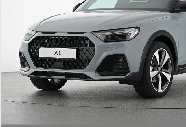
Audi Zentrum Essen GOTTFRIED SCHULTZ

Angebotsnummer: 83228 Ausdruck vom: 28.04.2024