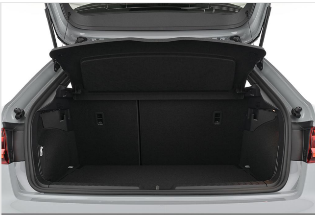
Audi Zentrum Essen GOTTFRIED SCHULTZ