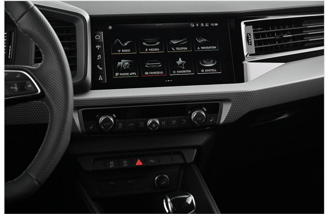
Audi Zentrum Essen GOTTFRIED SCHULTZ