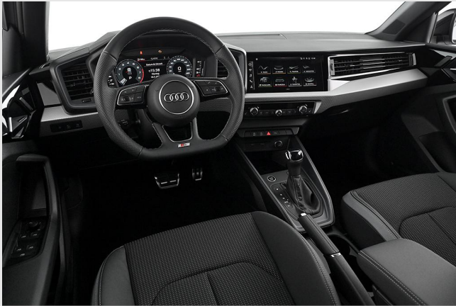
Audi Zentrum Essen GOTTFRIED SCHULTZ

Angebotsnummer: 83228 Ausdruck vom: 28.04.2024