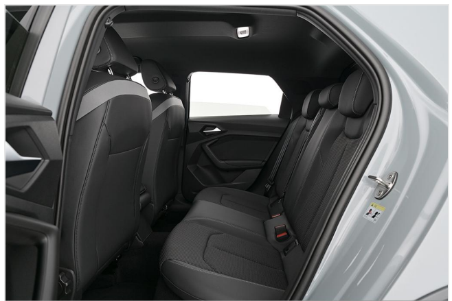
Audi Zentrum Essen GOTTFRIED SCHULTZ