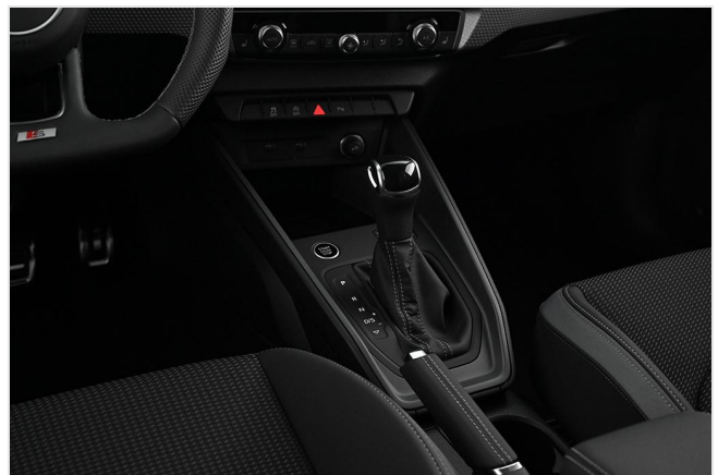
Audi Zentrum Essen GOTTFRIED SCHULTZ