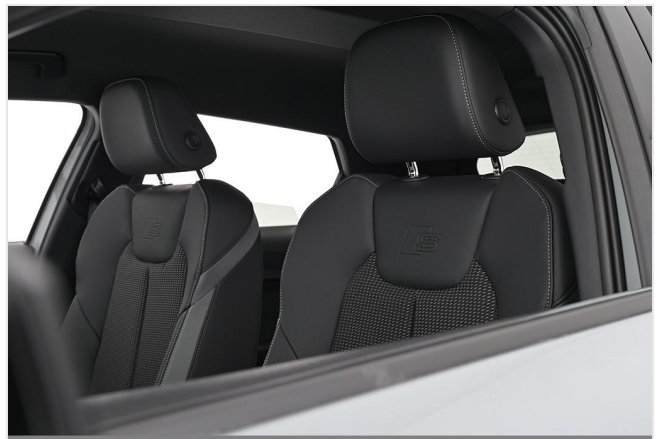
Audi Zentrum Essen GOTTFRIED SCHULTZ