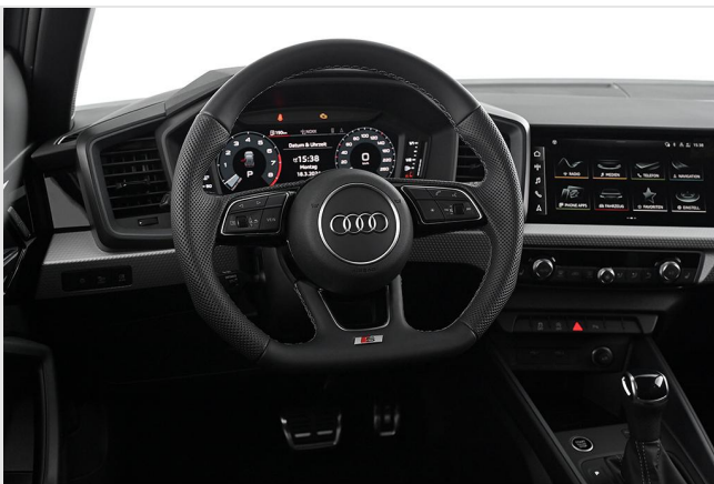
Audi Zentrum Essen GOTTFRIED SCHULTZ