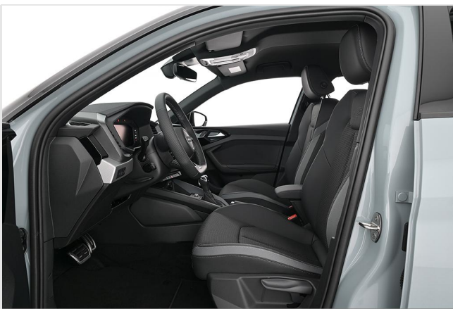
Audi Zentrum Essen GOTTFRIED SCHULTZ