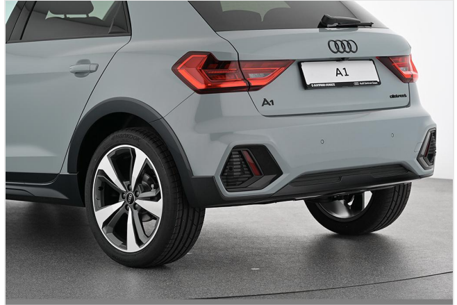
Audi Zentrum Essen GOTTFRIED SCHULTZ