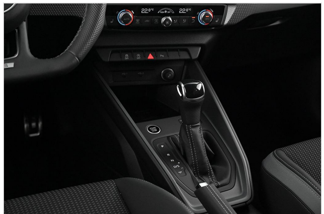
Audi Zentrum Essen GOTTFRIED SCHULTZ