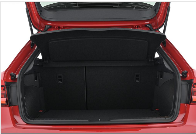
Audi Zentrum Essen GOTTFRIED SCHULTZ