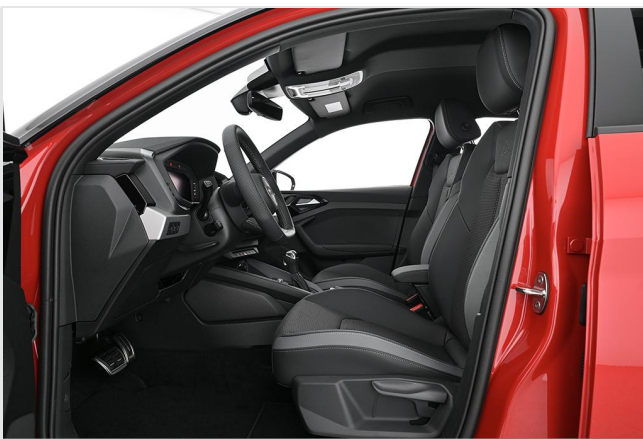
Audi Zentrum Essen GOTTFRIED SCHULTZ