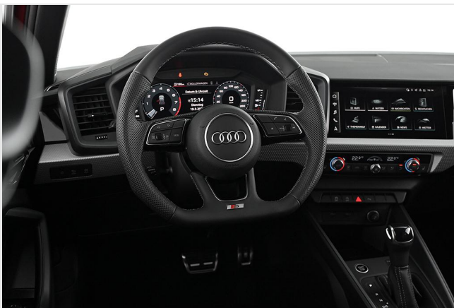
Audi Zentrum Essen GOTTFRIED SCHULTZ