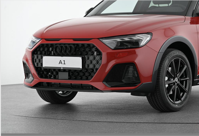
Audi Zentrum Essen GOTTFRIED SCHULTZ

Angebotsnummer: 83230 Ausdruck vom: 27.04.2024