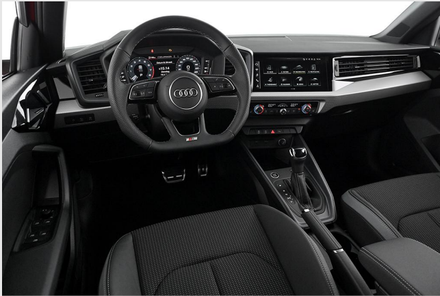
Audi Zentrum Essen GOTTFRIED SCHULTZ

Angebotsnummer: 83230 Ausdruck vom: 27.04.2024