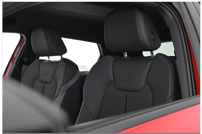
Audi Zentrum Essen GOTTFRIED SCHULTZ