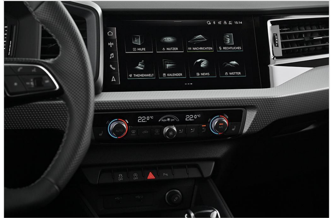
Audi Zentrum Essen GOTTFRIED SCHULTZ