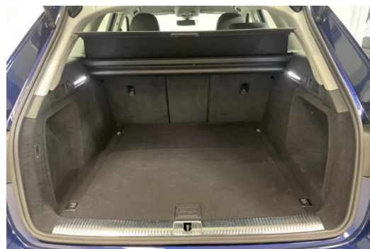
Audi Zentrum Düsseldorf GOTTFRIED SCHULTZ