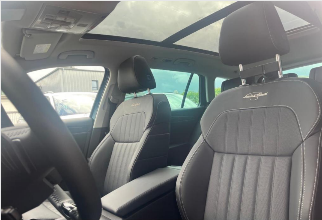
Škoda Centrum Düsseldorf GOTTFRIED SCHULTZ

Angebotsnummer: 35008 Ausdruck vom: 28.04.2024