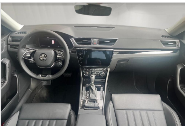
Škoda Centrum Düsseldorf GOTTFRIED SCHULTZ