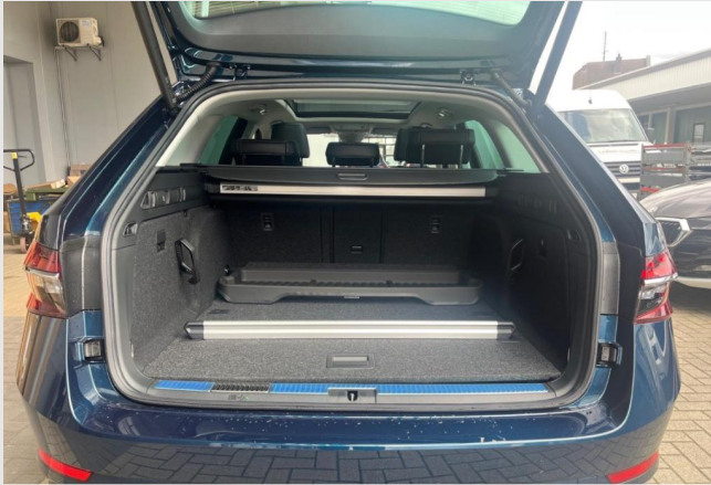
Škoda Centrum Düsseldorf GOTTFRIED SCHULTZ

Angebotsnummer: 35008 Ausdruck vom: 28.04.2024