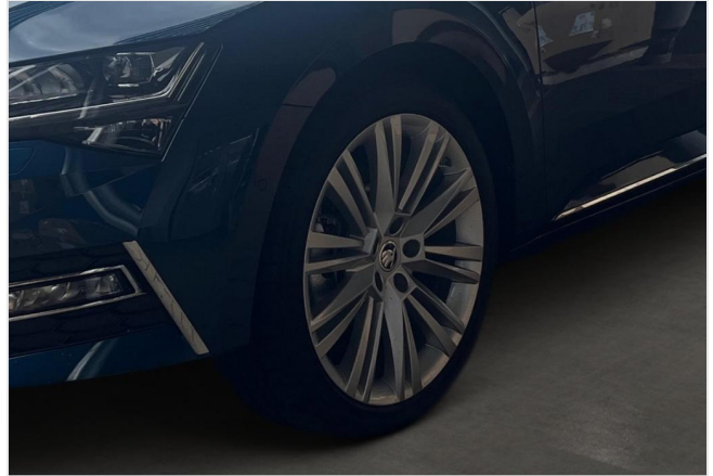
Škoda Centrum Düsseldorf GOTTFRIED SCHULTZ