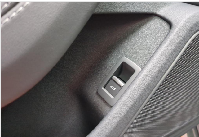
Audi Zentrum Duisburg GOTTFRIED SCHULTZ