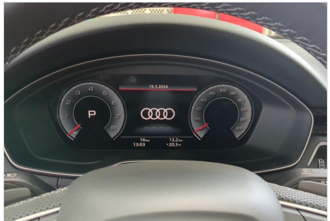
Audi Zentrum Duisburg GOTTFRIED SCHULTZ