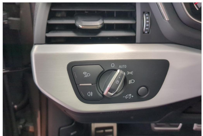
Audi Zentrum Duisburg GOTTFRIED SCHULTZ