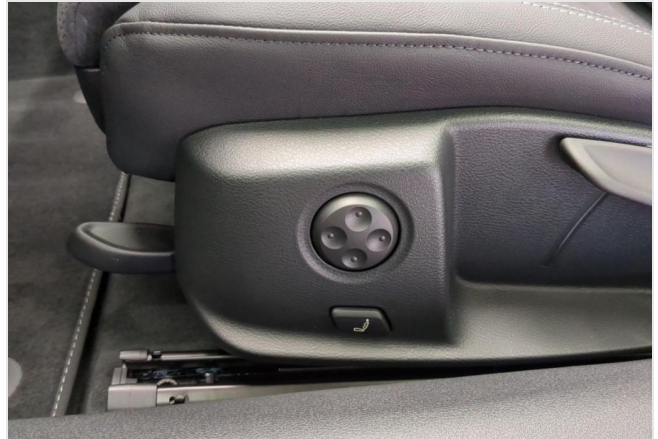
Audi Zentrum Duisburg GOTTFRIED SCHULTZ