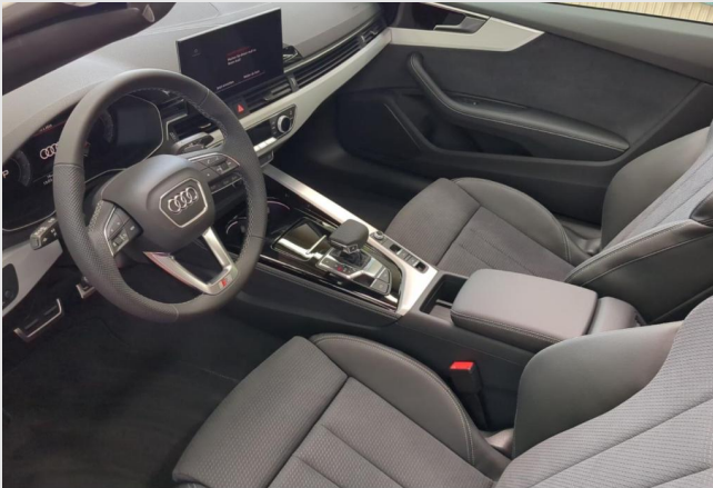
Audi Zentrum Duisburg GOTTFRIED SCHULTZ

Angebotsnummer: 41072 Ausdruck vom: 29.04.2024