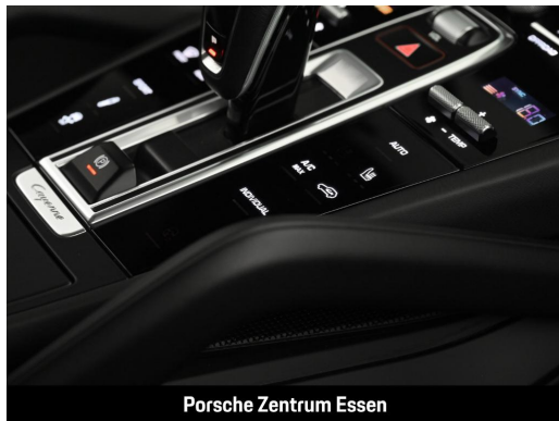
Porsche Zentrum Essen