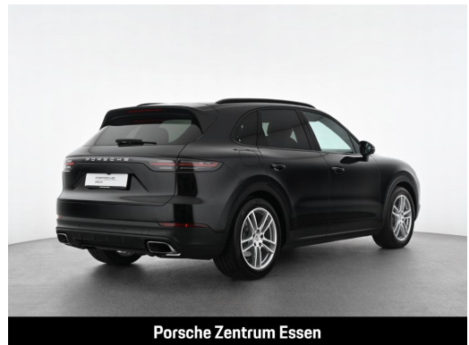
Porsche Zentrum Essen