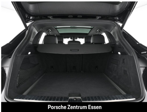
Porsche Zentrum Essen