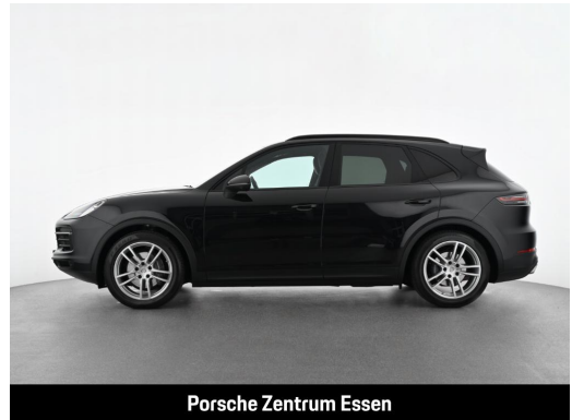
Porsche Zentrum Essen