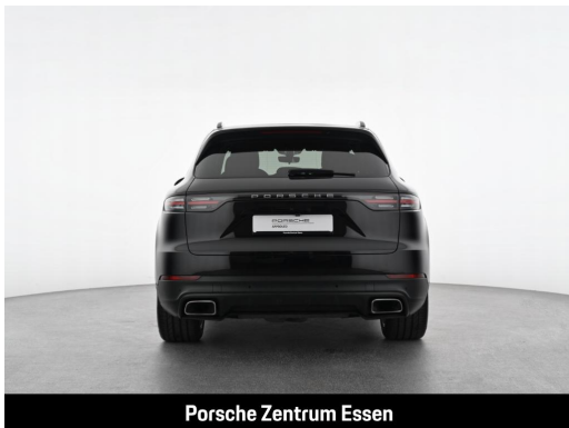
Porsche Zentrum Essen