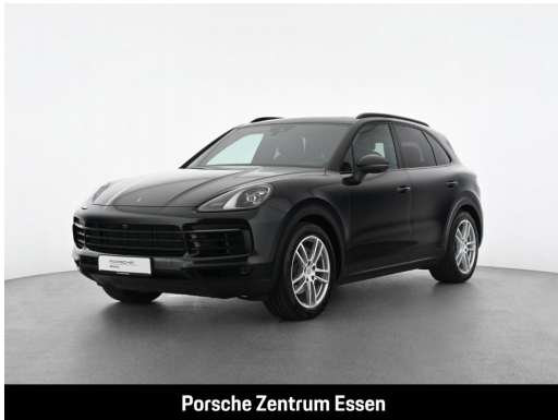
Porsche Zentrum Essen