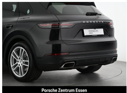
Porsche Zentrum Essen