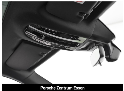
Porsche Zentrum Essen