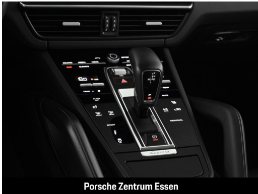
Porsche Zentrum Essen