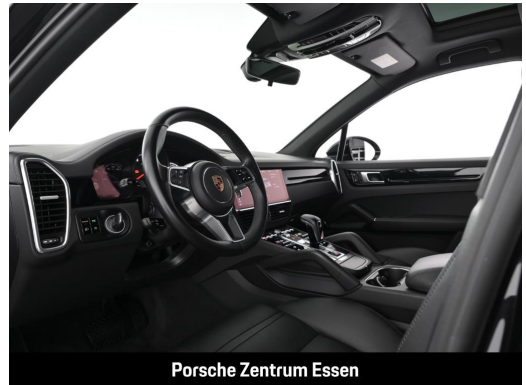
Porsche Zentrum Essen