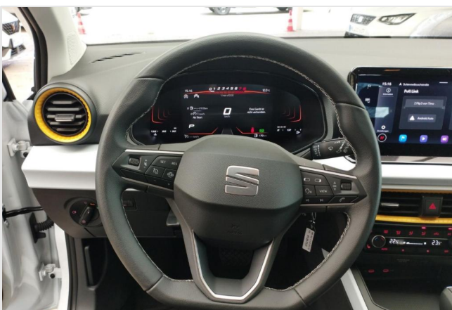
Erkrath GOTTFRIED SCHULTZ