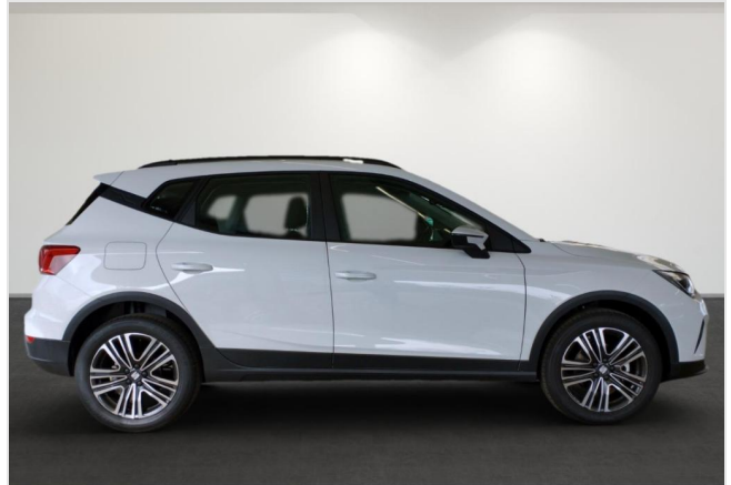
Erkrath GOTTFRIED SCHULTZ