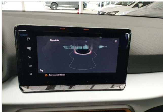
Erkrath GOTTFRIED SCHULTZ