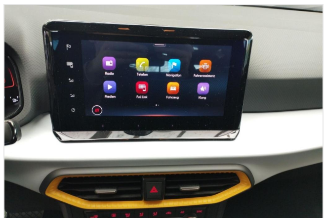
Erkrath GOTTFRIED SCHULTZ