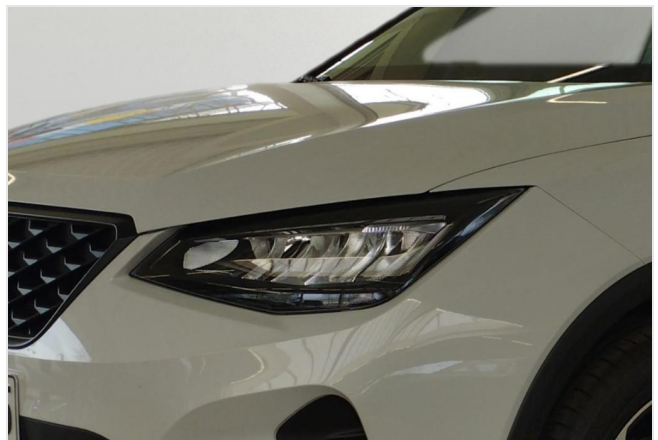
Erkrath GOTTFRIED SCHULTZ