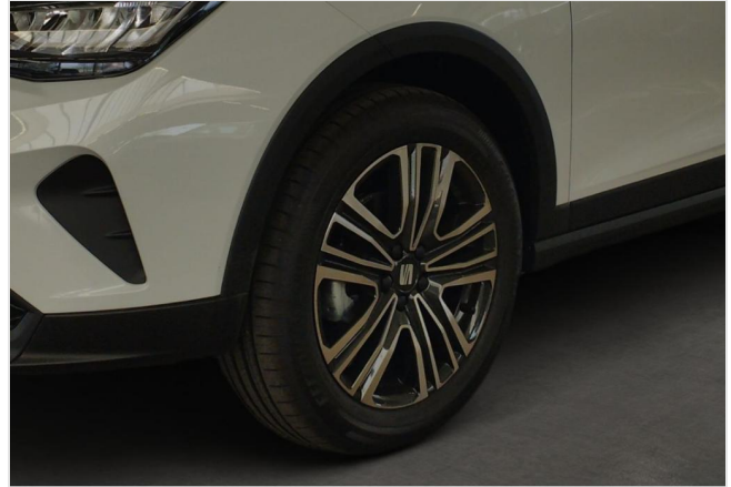
Erkrath GOTTFRIED SCHULTZ