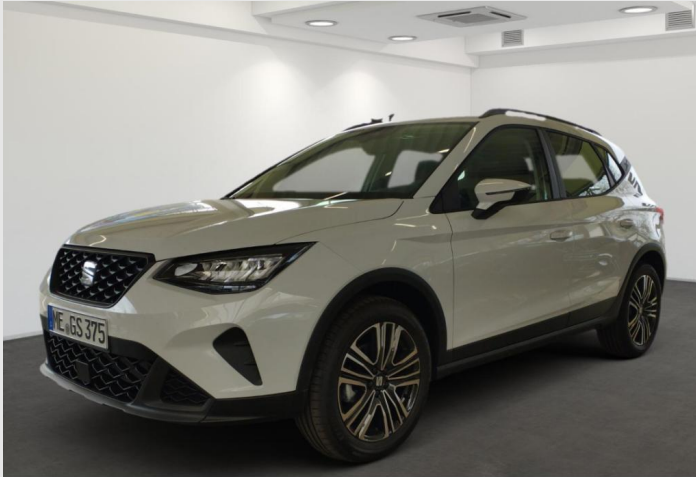
Erkrath GOTTFRIED SCHULTZ