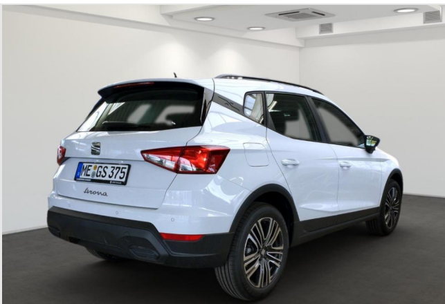
Erkrath GOTTFRIED SCHULTZ