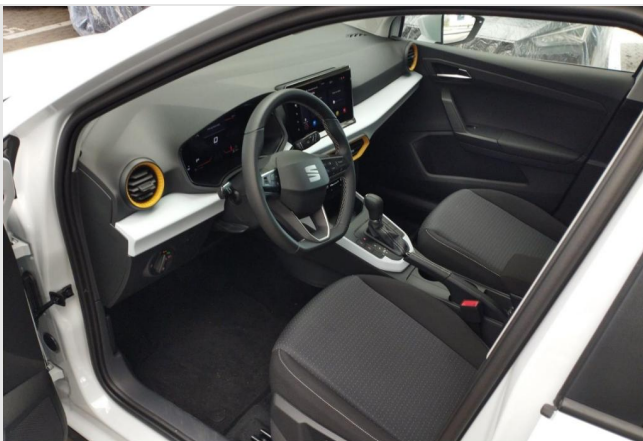
Erkrath GOTTFRIED SCHULTZ