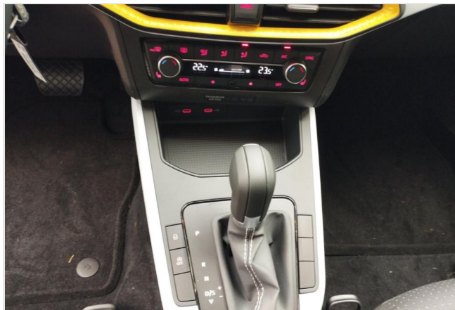
Erkrath GOTTFRIED SCHULTZ

Angebotsnummer: 04784 Ausdruck vom: 28.04.2024