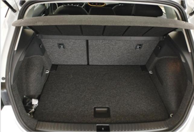
Erkrath GOTTFRIED SCHULTZ

Angebotsnummer: 04784 Ausdruck vom: 28.04.2024