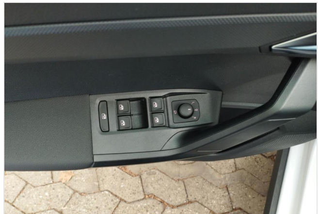
Erkrath GOTTFRIED SCHULTZ