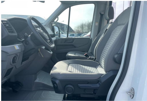
Eszen-Kray GOTTFRIED SCHULTZ