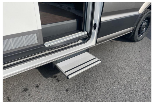
Eszen-Kray GOTTFRIED SCHULTZ