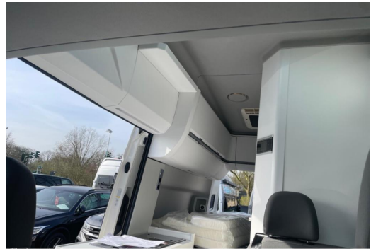
Eszen-Kray GOTTFRIED SCHULTZ