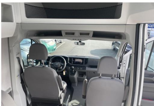
Eszen-Kray GOTTFRIED SCHULTZ