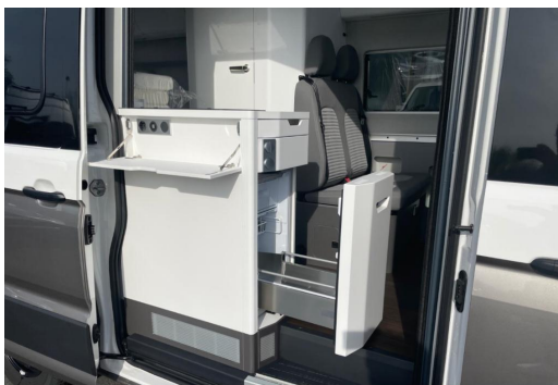
Eszen-Kray GOTTFRIED SCHULTZ