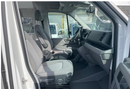
Eszen-Kray GOTTFRIED SCHULTZ