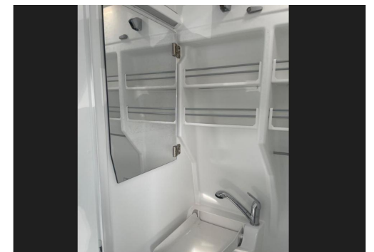
Eszen-Kray GOTTFRIED SCHULTZ