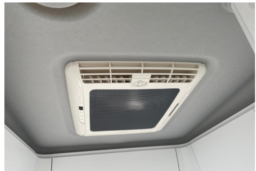
Eszen-Kray GOTTFRIED SCHULTZ