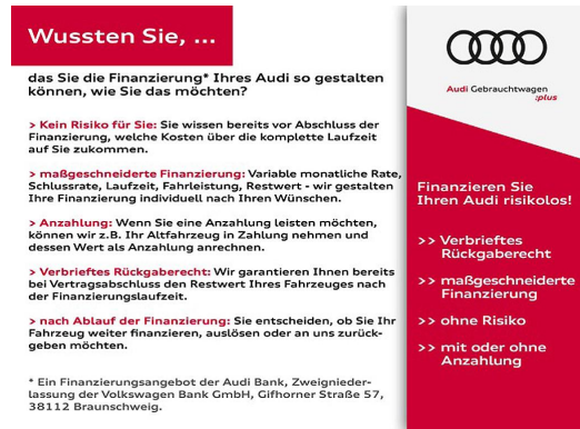
Audi Gebrauchtwagen plus