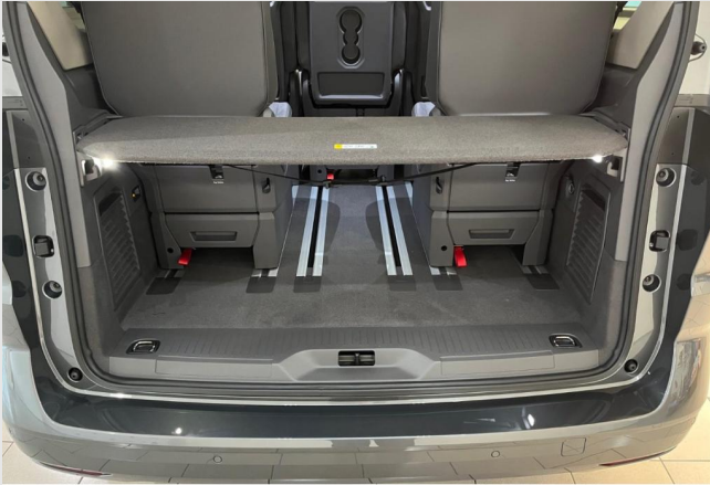
Auto Wolf GOTTFRIED SCHULTZ

Angebotsnummer: 53673 Ausdruck vom: 28.04.2024