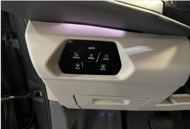
Auto Wolf GOTTFRIED SCHULTZ

Angebotsnummer: 53673 Ausdruck vom: 28.04.2024