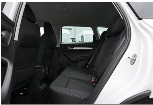
Wuppertal GOTTFRIED SCHULTZ