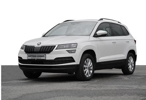
Wuppertal GOTTFRIED SCHULTZ