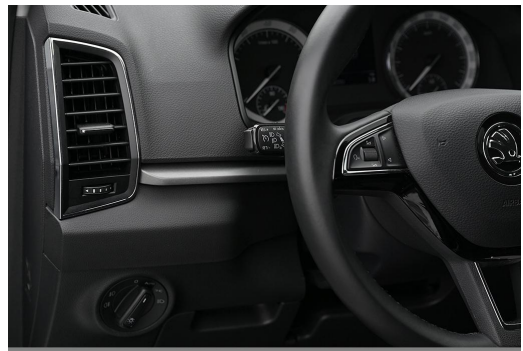
Wuppertal GOTTFRIED SCHULTZ