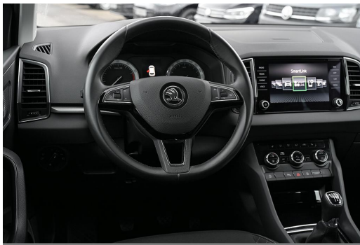
Wuppertal GOTTFRIED SCHULTZ