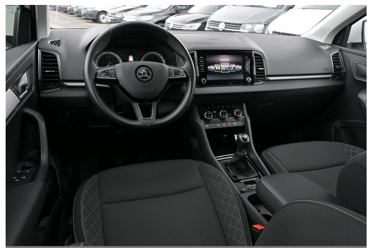
Wuppertal GOTTFRIED SCHULTZ