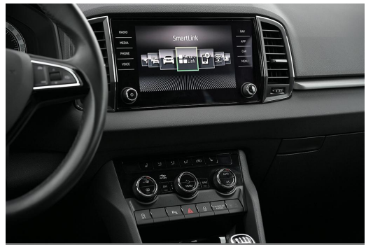
Wuppertal GOTTFRIED SCHULTZ