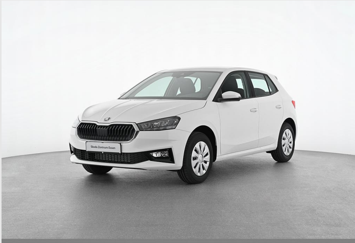
Skoda Zentrum Essen GOTTFRIED SCHULTZ