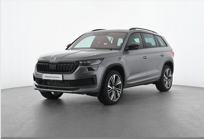
Skoda Zentrum Essen GOTTFRIED SCHULTZ