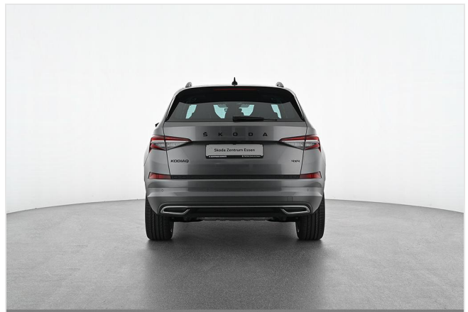
Škoda Zentrum Essen GOTTFRIED SCHULTZ