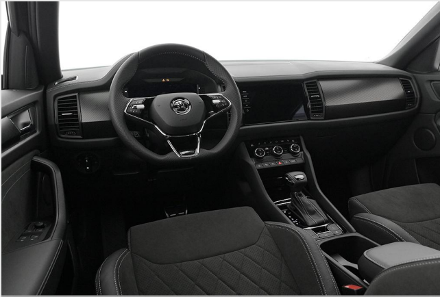
Škoda Zentrum Essen GOTTFRIED SCHULTZ

Angebotsnummer: 82901 Ausdruck vom: 28.04.2024