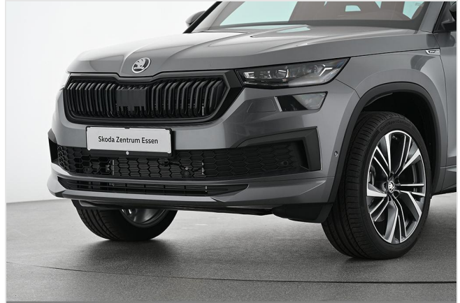
Škoda Zentrum Essen GOTTFRIED SCHULTZ