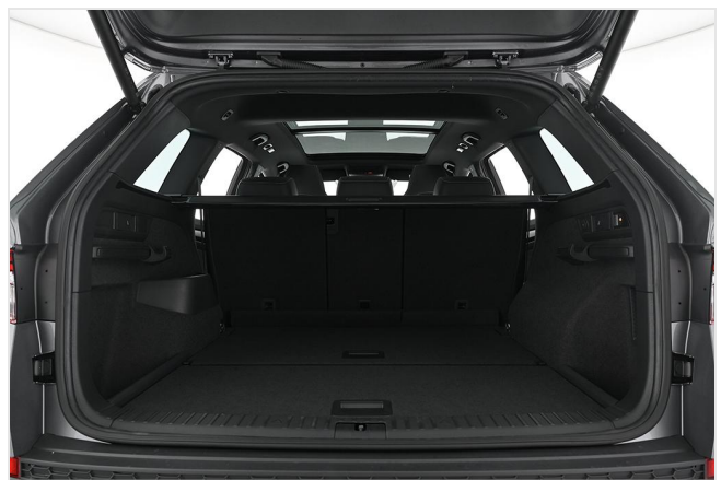
Škoda Zentrum Essen GOTTFRIED SCHULTZ