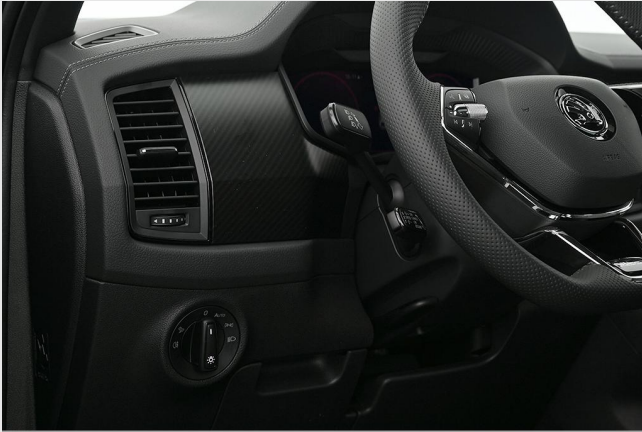
Škoda Zentrum Essen GOTTFRIED SCHULTZ

Angebotsnummer: 82901 Ausdruck vom: 28.04.2024