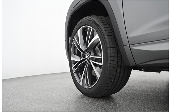
Škoda Zentrum Essen GOTTFRIED SCHULTZ