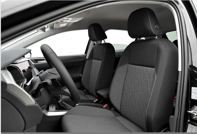
Velbert GOTTFRIED SCHULTZ

Angebotsnummer: 42808 Ausdruck vom: 29.04.2024