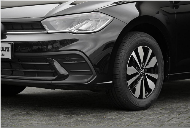
Velbert GOTTFRIED SCHULTZ

Angebotsnummer: 42808 Ausdruck vom: 29.04.2024