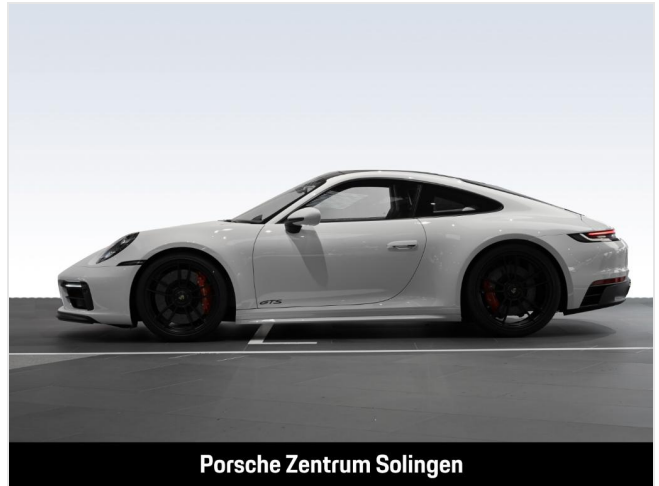
Porsche Zentrum Solingen