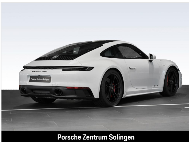
Porsche Zentrum Solingen