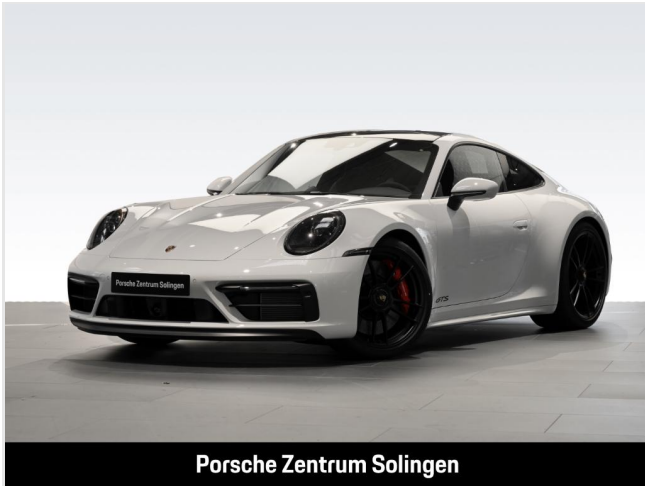
Porsche Zentrum Solingen