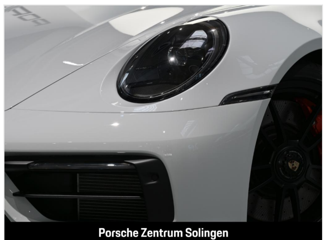
Porsche Zentrum Solingen