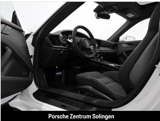
Porsche Zentrum Solingen