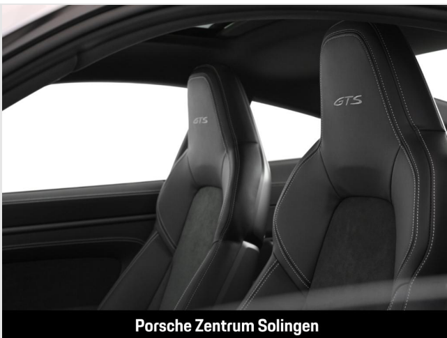
Porsche Zentrum Solingen