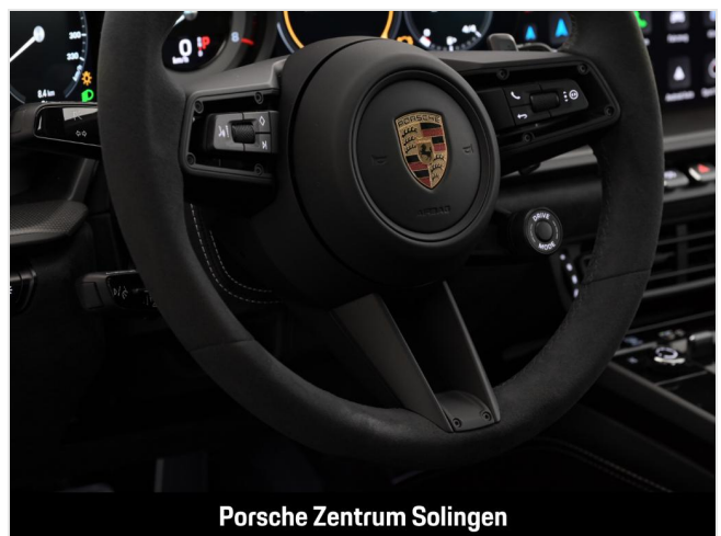
Porsche Zentrum Solingen