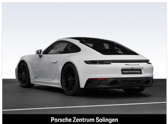
Porsche Zentrum Solingen