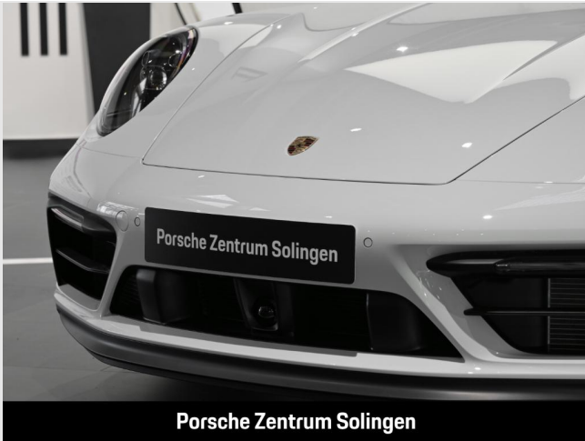
Porsche Zentrum Solingen

Angebotsnummer: C61445 Ausdruck vom: 29.04.2024