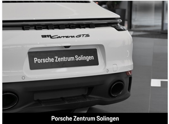
Porsche Zentrum Solingen