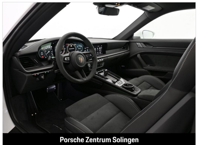
Porsche Zentrum Solingen