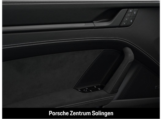
Porsche Zentrum Solingen