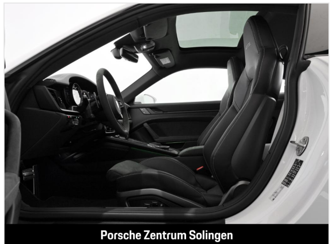
Porsche Zentrum Solingen