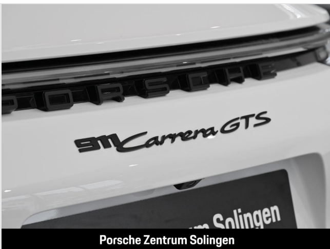
Porsche Zentrum Solingen