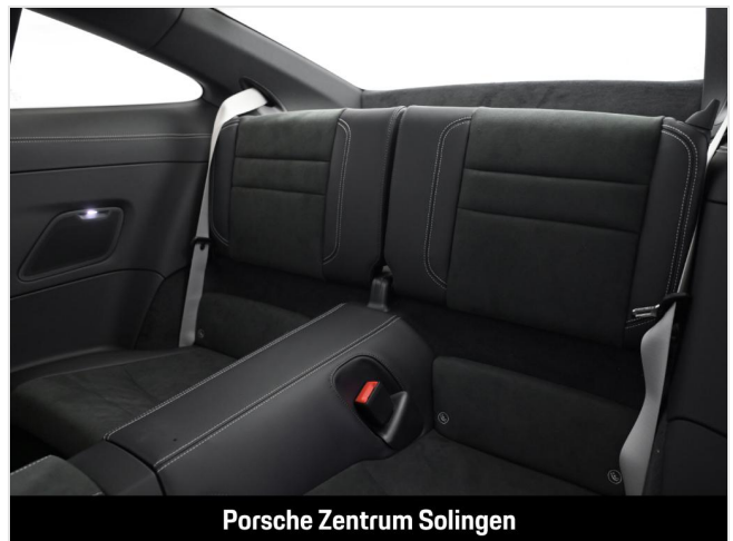
Porsche Zentrum Solingen