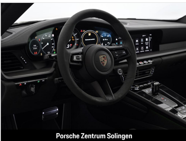
Porsche Zentrum Solingen