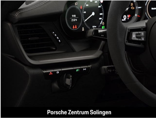
Porsche Zentrum Solingen

Angebotsnummer: C61445 Ausdruck vom: 29.04.2024