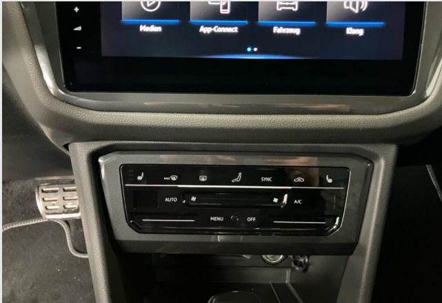
Hagen GOTTFRIED SCHULTZ

Angebotsnummer: 91066 Ausdruck vom: 27.04.2024