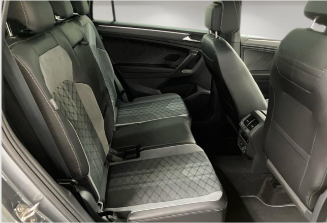
Hagen GOTTFRIED SCHULTZ

Angebotsnummer: 91066 Ausdruck vom: 27.04.2024