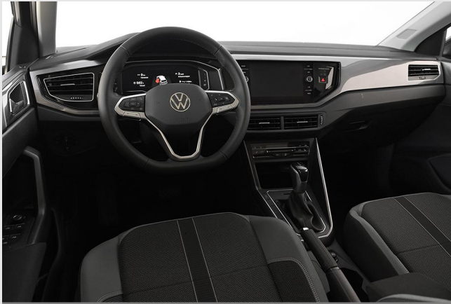
Velbert GOTTFRIED SCHULTZ

Angebotsnummer: 44800 Ausdruck vom: 28.04.2024