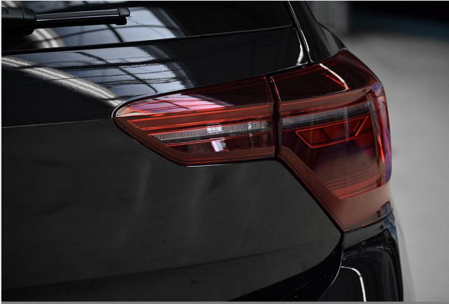
Velbert GOTTFRIED SCHULTZ

Angebotsnummer: 44800 Ausdruck vom: 28.04.2024