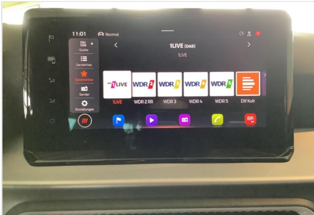
Düsseldorf-Benrath GOTTFRIED SCHULTZ

Angebotsnummer: 05047 Ausdruck vom: 27.04.2024