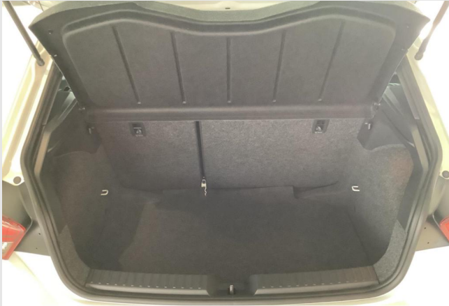
Düsseldorf-Benrath GOTTFRIED SCHULTZ

Angebotsnummer: 05047 Ausdruck vom: 27.04.2024