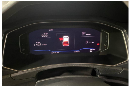
Volkswagen Zentrum Düsseldorf GOTTFRIED SCHULTZ