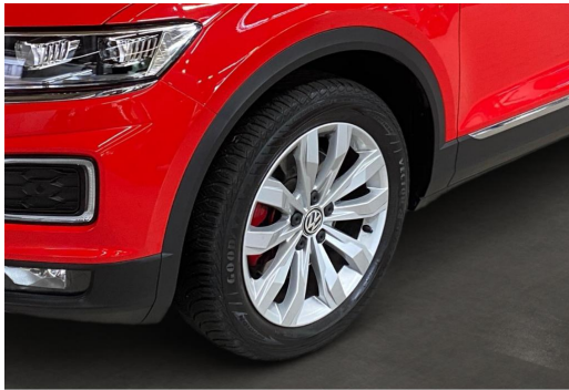
Volkswagen Zentrum Düsseldorf GOTTFRIED SCHULTZ