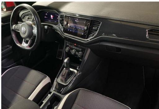
Volkswagen Zentrum Düsseldorf GOTTFRIED SCHULTZ