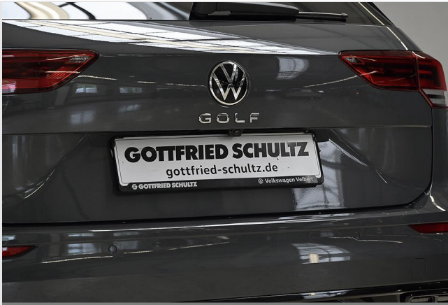
Velbert GOTTFRIED SCHULTZ

Angebotsnummer: 40339 Ausdruck vom: 28.04.2024