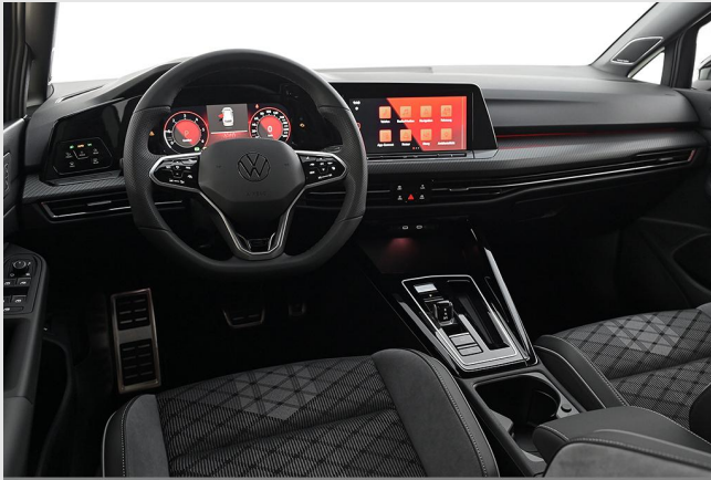
Velbert GOTTFRIED SCHULTZ

Angebotsnummer: 40339 Ausdruck vom: 28.04.2024