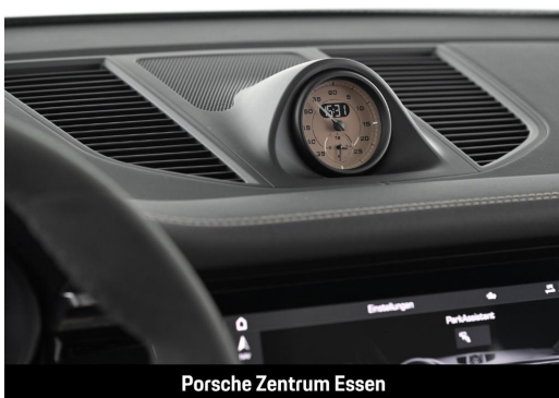
Porsche Zentrum Essen