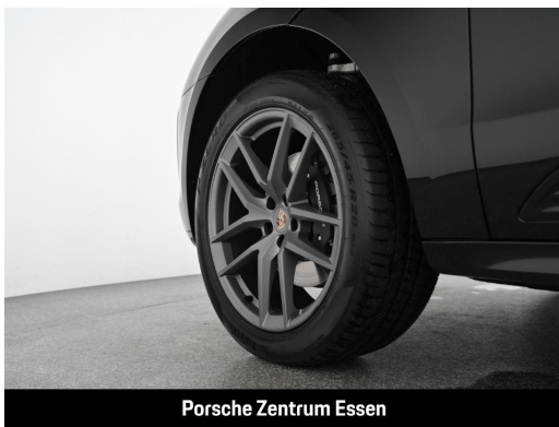
Porsche Zentrum Essen