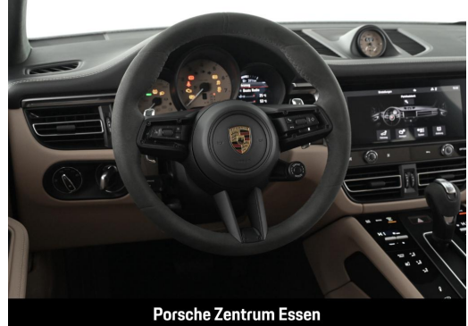
Porsche Zentrum Essen