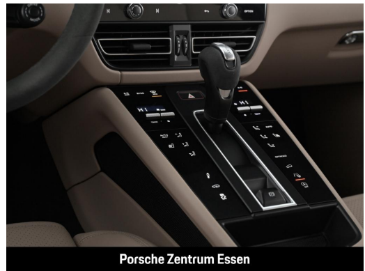
Porsche Zentrum Essen