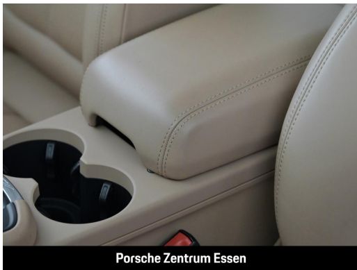
Porsche Zentrum Essen