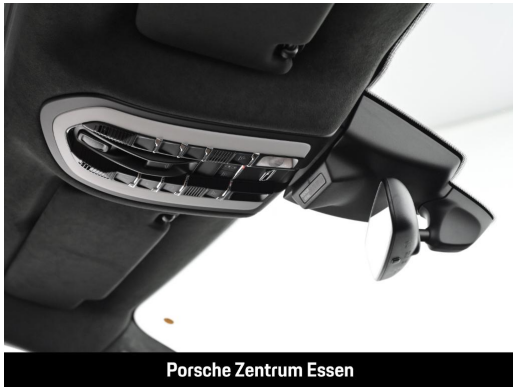
Porsche Zentrum Essen