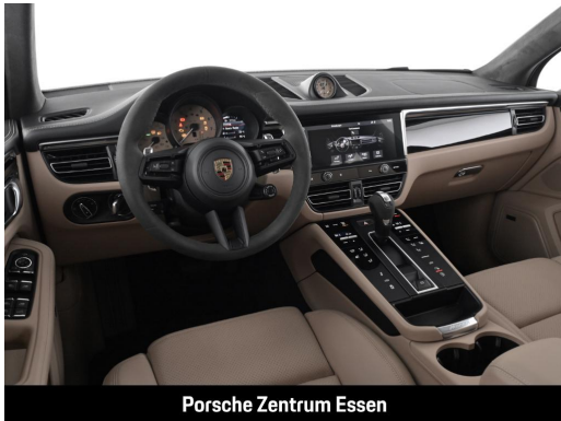
Porsche Zentrum Essen