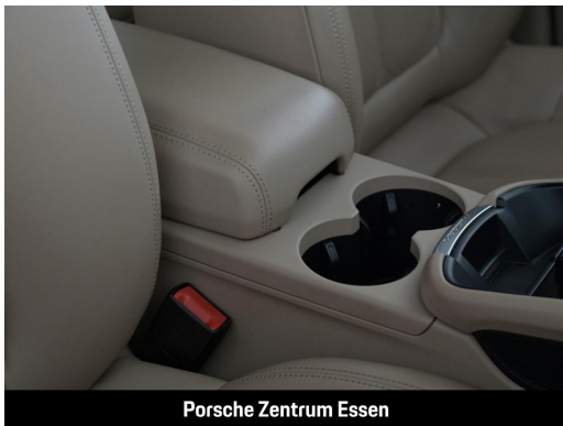
Porsche Zentrum Essen