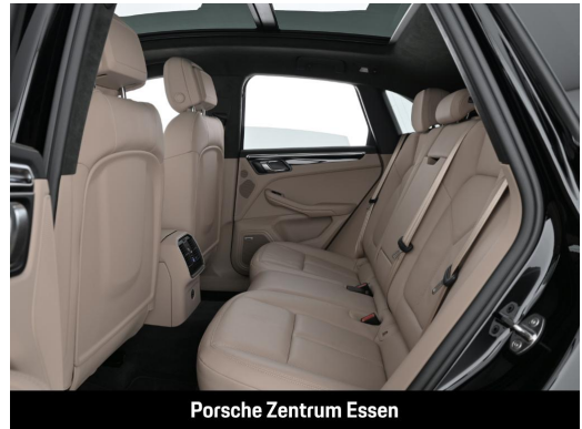
Porsche Zentrum Essen