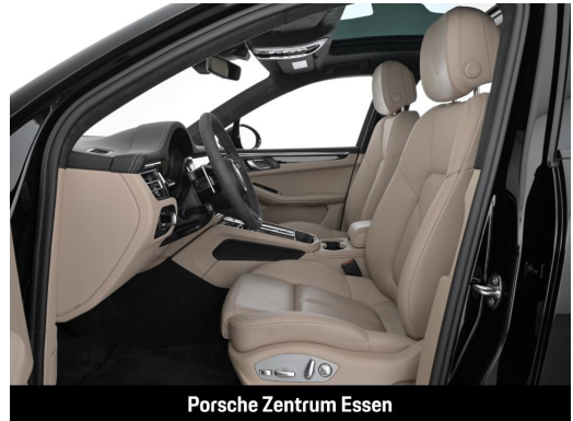
Porsche Zentrum Essen