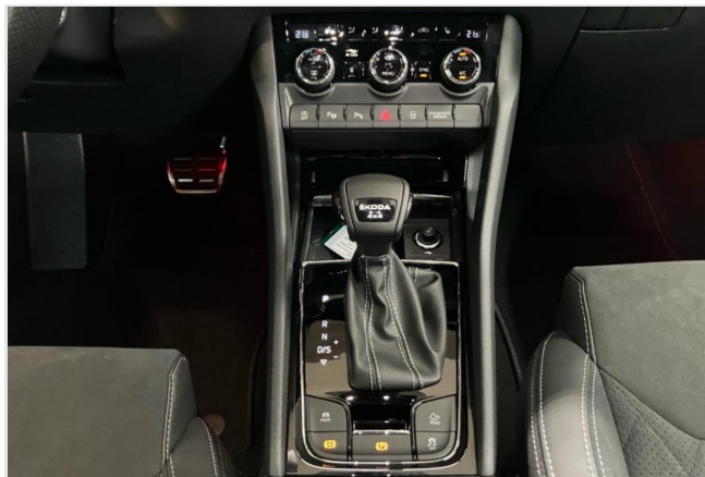
Hagen GOTTFRIED SCHULTZ

Angebotsnummer: 26799 Ausdruck vom: 27.04.2024