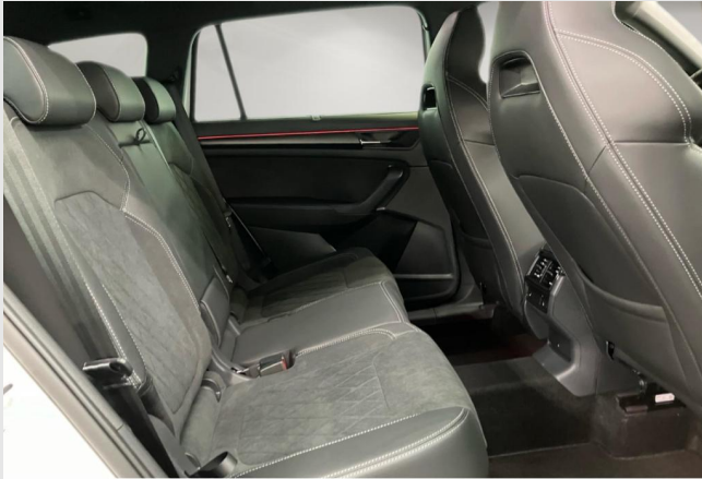
Hagen GOTTFRIED SCHULTZ

Angebotsnummer: 26799 Ausdruck vom: 27.04.2024