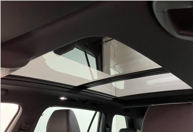
Hagen GOTTFRIED SCHULTZ

Angebotsnummer: 26799 Ausdruck vom: 27.04.2024