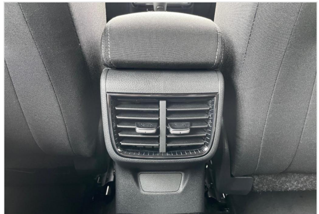
Dormagen GOTTFRIED SCHULTZ