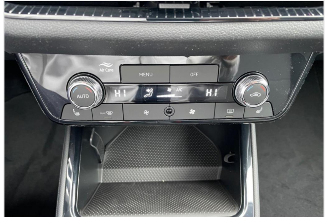
Dormagen GOTTFRIED SCHULTZ