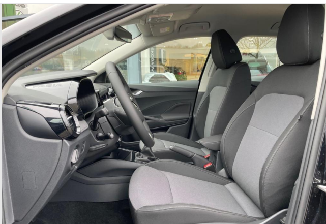
Dormagen GOTTFRIED SCHULTZ