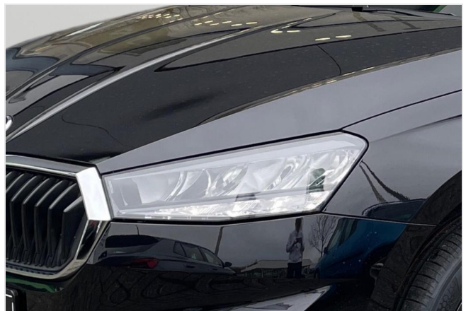
Dormagen GOTTFRIED SCHULTZ