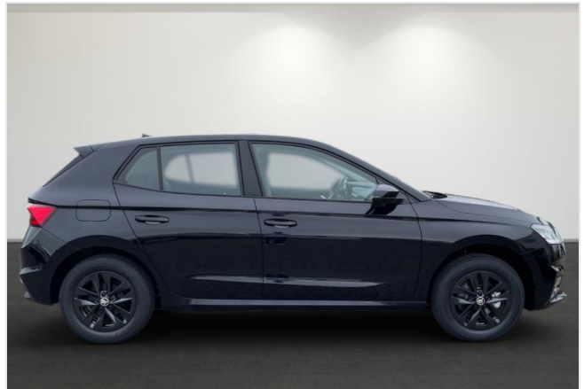
Dormagen GOTTFRIED SCHULTZ