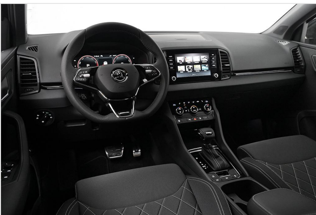
Wuppertal GOTTFRIED SCHULTZ