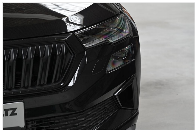
Wuppertal GOTTFRIED SCHULTZ