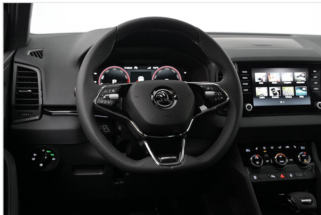
Wuppertal GOTTFRIED SCHULTZ

Angebotsnummer: 26156 Ausdruck vom: 28.04.2024