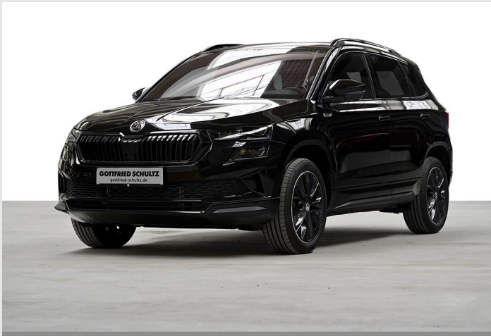
Wuppertal GOTTFRIED SCHULTZ