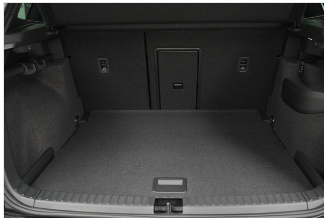
Wuppertal GOTTFRIED SCHULTZ