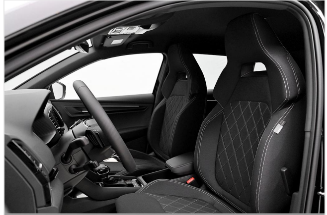
Wuppertal GOTTFRIED SCHULTZ