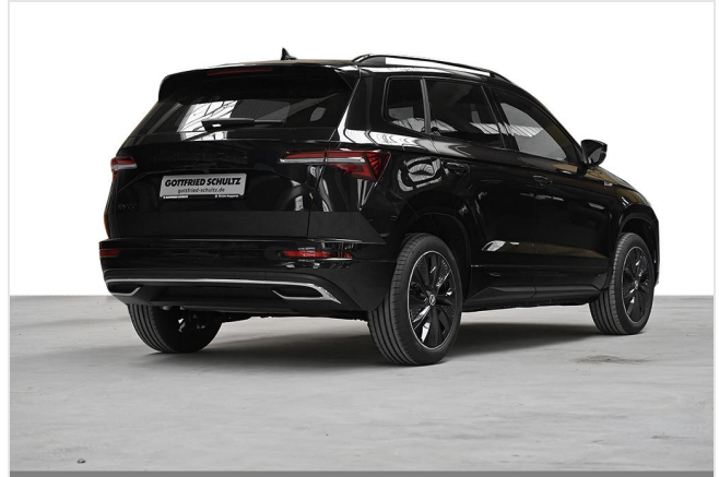
Wuppertal GOTTFRIED SCHULTZ