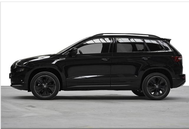
Wuppertal GOTTFRIED SCHULTZ