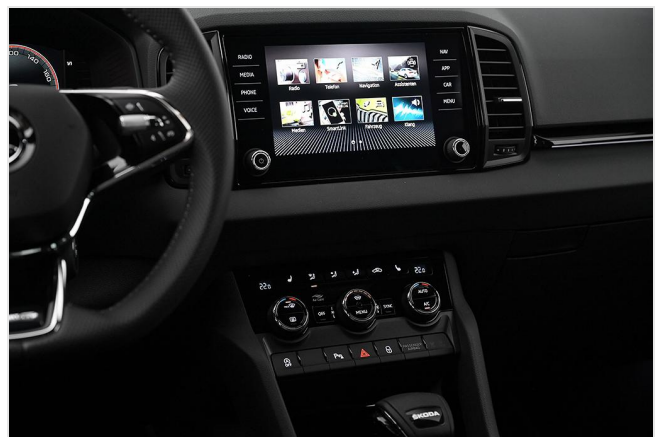
Wuppertal GOTTFRIED SCHULTZ