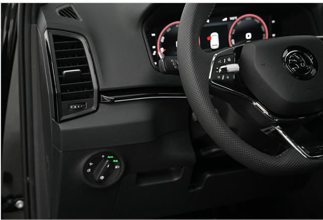
Wuppertal GOTTFRIED SCHULTZ