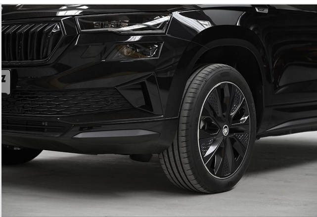
Wuppertal GOTTFRIED SCHULTZ