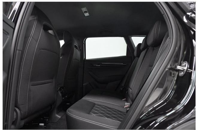
Wuppertal GOTTFRIED SCHULTZ