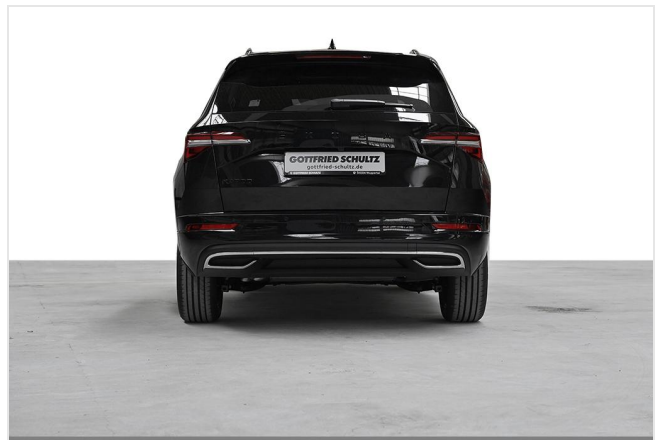
Wuppertal GOTTFRIED SCHULTZ