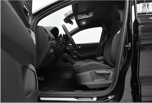
Wuppertal GOTTFRIED SCHULTZ

Angebotsnummer: 26156 Ausdruck vom: 28.04.2024