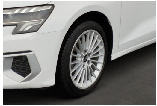
Audi Zentrum Düsseldorf GOTTFRIED SCHULTZ