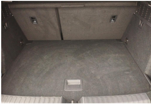
Audi Zentrum Düsseldorf GOTTFRIED SCHULTZ