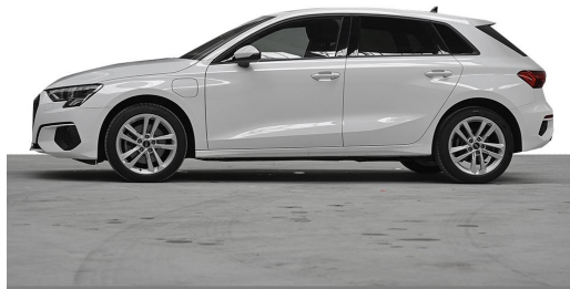
Audi Zentrum Wuppertal GOTTFRIED SCHULTZ Audi Gebrauchtwagen plus