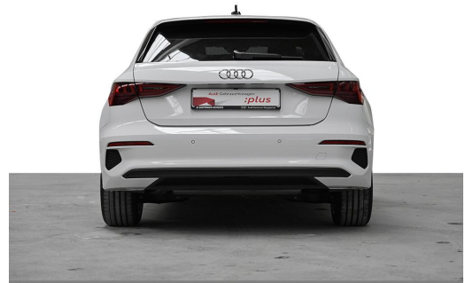
Audi Zentrum Wuppertal GOTTFRIED SCHULTZ Audi Gebrauchtwagen plus