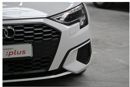
Audi Zentrum Wuppertal GOTTFRIED SCHULTZ Audi Gebrauchtwagen plus