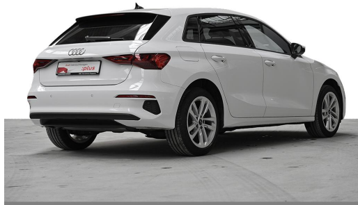
Audi Zentrum Wuppertal GOTTFRIED SCHULTZ Audi Gebrauchtwagen plus