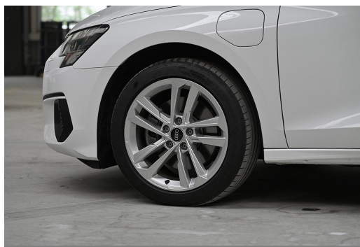
Audi Zentrum Wuppertal GOTTFRIED SCHULTZ Audi Gebrauchtwagen plus