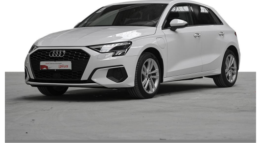
Audi Zentrum Wuppertal GOTTFRIED SCHULTZ Audi Gebrauchtwagen plus