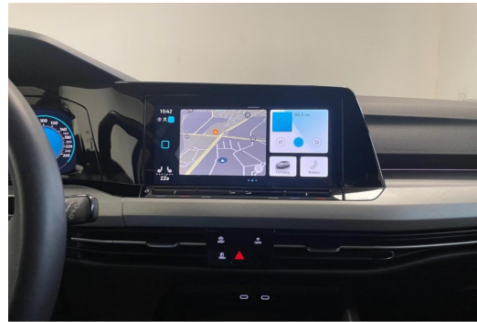
Volkswagen Zentrum Düsseldorf GOTTFRIED SCHULTZ