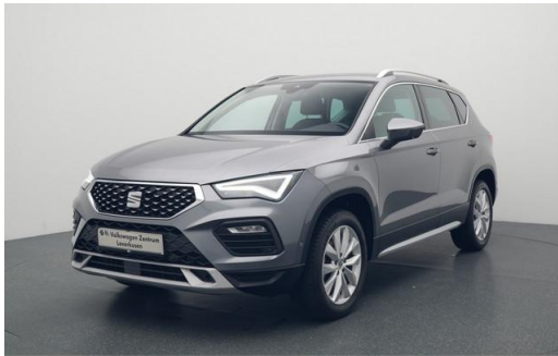
Volkswagen Zentrum Leverkusen